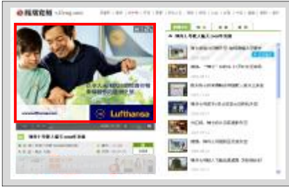
視頻節目播出前廣告展現