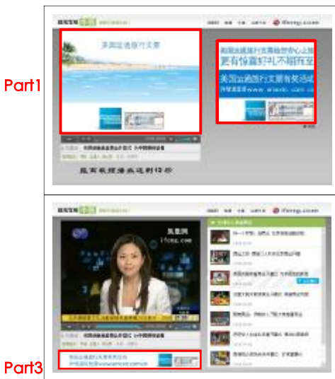
視頻節目播出前廣告展現